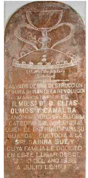
Lápida conmemorativa en el interior de la casa