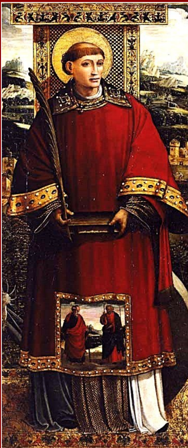
San Vicente Mártir, Gaspar Godos (Maestro de Alzira), s. XVI. Catedral de Valencia

“Con los ojos de la fe hemos contemplado un grandioso espectáculo: la victoria en todo del santo mártir Vicente. Venció en el interrogatorio, venció en los tormentos, venció en la confesión, venció en la tribulación, venció quemado por las llamas, venció sumergido en las olas; finalmente, venció en la tortura, venció en la muerte”.