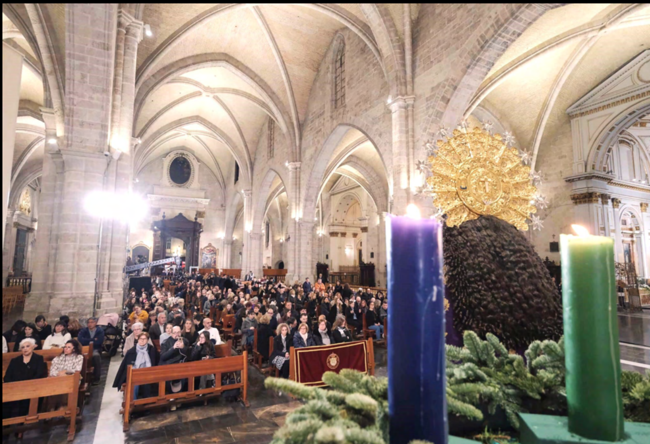
Bajo la mirada de la Mare de Déu, la Nave Central se destinó a los familiares de los difuntos