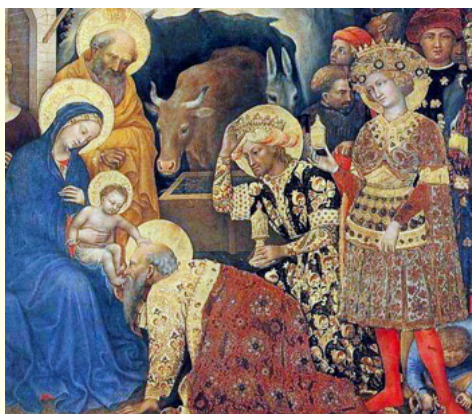
LOS MAGOS DE ORIENTE

El texto bíblico da a entender que eran unos sabios, quizás de la tribu meda en Persia, con conocimientos astronómicos, que pudieron tener acceso a las profecías de Daniel sobre la llegada del Mesías (Daniel había sido un alto dignatario en Babilonia). Al aparecer la estrella supieron que traía un significado especial que les movió a emprender una larga peregrinación con la intención religiosa de adorar al Señor recién nacido.