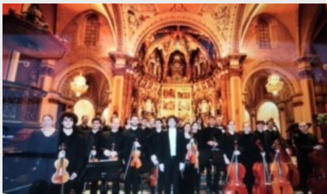
Concierto Cámara de Comercio