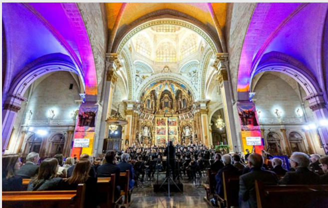
Concierto benéfico de Lo Rat Penat