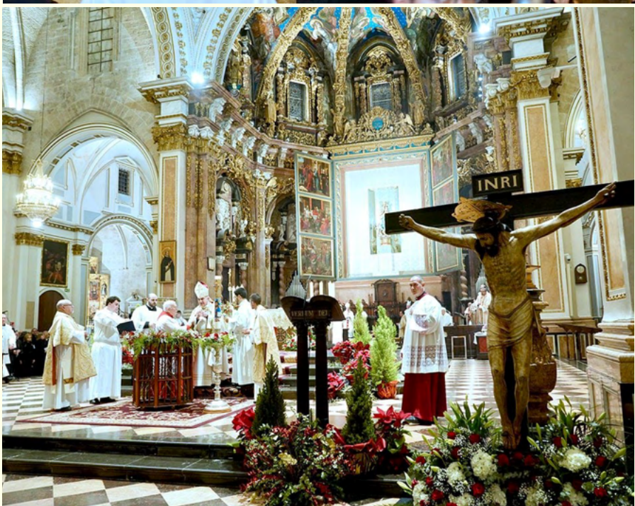
Arriba, procesión de entrada (calle Micalet), y aspecto del altar con el Cristo del Rescate

el Arzobispo señaló que “los cristianos somos peregrinos, testimonios de la esperanza que nace de la fe”, y subrayó que la esperanza que hemos de anunciar al mundo es la Vida Eterna, que es la que da sentido a todas las demás esperanzas. Para la credibilidad del anuncio de esta esperanza, dijo, es necesario que seamos testigos de esperanza con serias obras de misericordia, con verdadera cercanía a los que sufren; y también estamos llamados a promover una cultura de la vida,