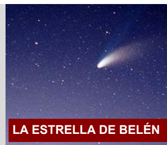
LA ESTRELLA DE BELÉN

Actualmente los niños reciben regalos de los Reyes Magos valiéndose de distintos medios y personas. Simbolizan, que el Niño Jesús es el gran y total regalo que hemos recibido.