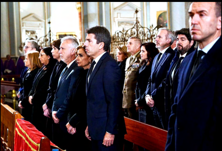
Las autoridades presentes, se situaron en la Nave del crucero