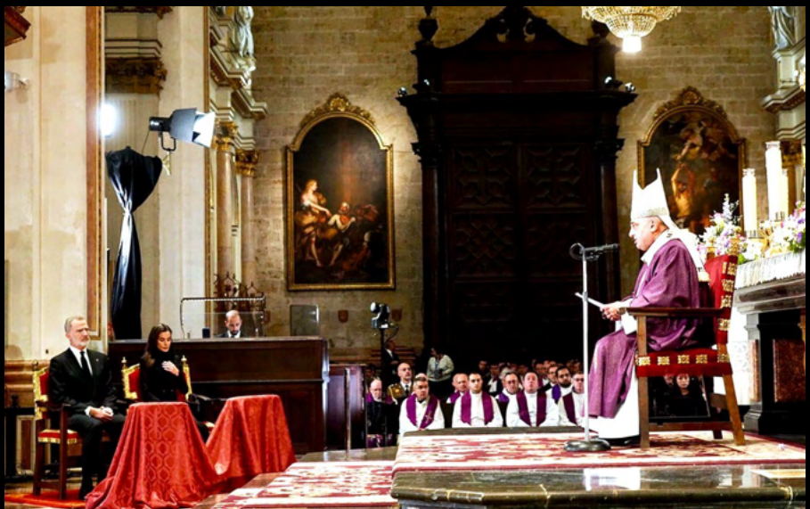
El Arzobispo, pronunciando la homilía ante los Reyes y la Catedral repleta

También subrayó que la esperanza ha de iluminar nuestras vidas, incluso en los momentos más complejos. Y, en este sentido, recordó que “en los acontecimientos tan dramáticos que hemos vivido, hemos visto muchos signos de esperanza, muchas personas que han fortalecido las manos débiles, que han animado a los inquietos y les han dicho: “sed fuertes, no temáis”; personas que han puesto gestos de alegría en medio de tanto sufrimiento. Son como pequeños brotes en medio de un desierto”. De hecho, destacó, esa solidaridad “ha sacado a la luz lo mejor que hay en el corazón del ser humano. Ha habido personas que, en las horas más dramáticas, han arriesgado su vida para salvar la de los demás; hemos visto la solidaridad de asociaciones e instituciones, entre las que hay que mencionar a la Iglesia (...) el testimonio de los miles y miles de voluntarios, muchos de ellos jóvenes que, de una manera espontánea se han ofrecido para ayudar a los afectados; la profesionalidad de los cuerpos