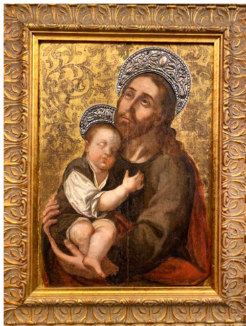
Anónimo, óleo sobre lienzo, ca 1610