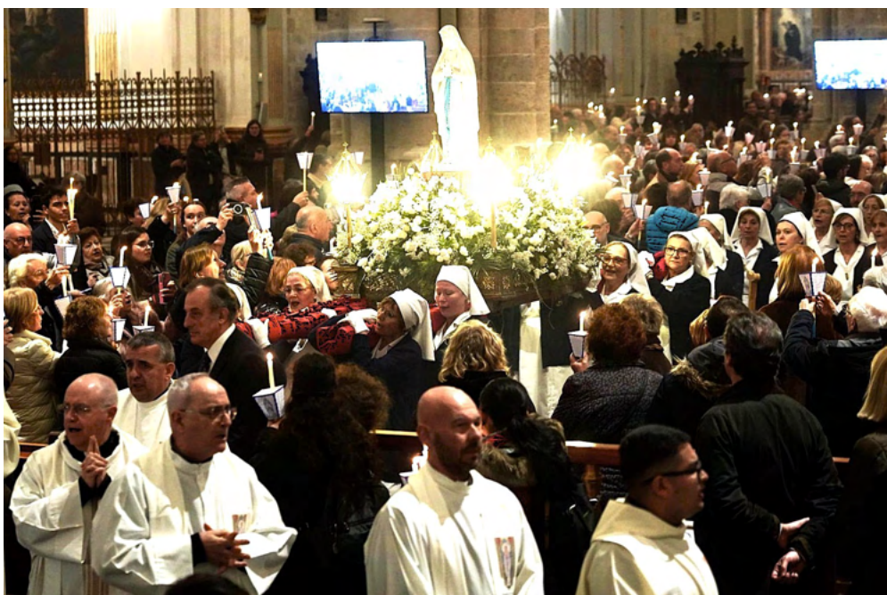
Procesión de las Antorchas