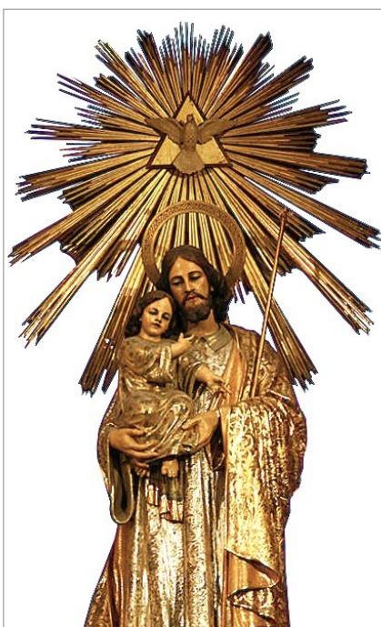
José M a Ponsoda, Imagen Titular de su capilla, s. XX

Esta capilla había estado dedicada hasta entonces a San Miguel, sufragada en el siglo XIV por el obispo Ramón Gastó (1312