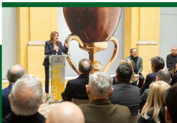
Presentan el Centro Interpretación del Santo Cáliz