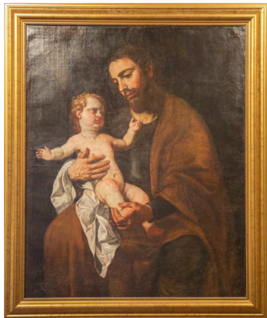
Espinosa, óleo sobre lienzo, s. XVII