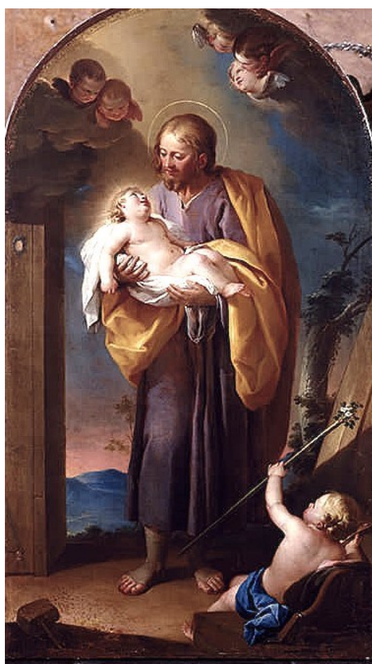
Camarón, óleo sobre lienzo, s. XVIII

-1348). Con la reforma para convertirla en capilla de San José, San Miguel pasó al altar lateral del lado izquierdo, donde estaba el altar de la Longitud de Cristo; y San Pedro Pascual al derecho, donde estaba el altar de Cristo clavado en la Cruz, obra perdida de Damià Forment, pintada por mestre Rodrigo Osona. Las esculturas actuales son de Francisco Sanchis