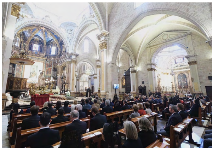
Imagen de la celebración de la Misa y la imagen del Santo dispuesta para la Procesión