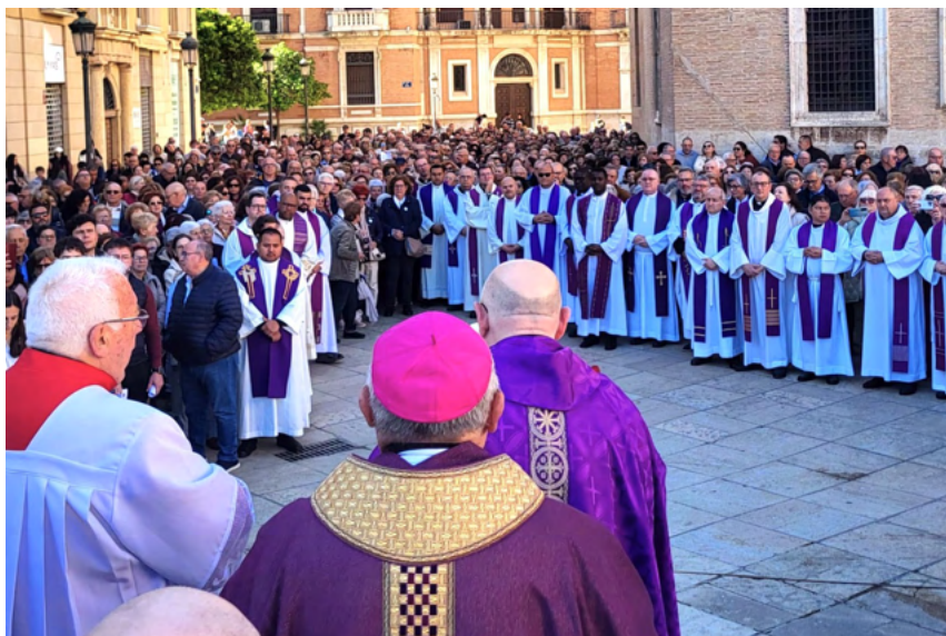
Vicarías V y VI, al inicio de la celebración.

En tercer lugar, señaló que en la peregrinación por este mundo los cristianos estamos llamados a ser instrumentos de paz y de unión; “hemos de dar testimonio de que la fe que nos une es mucho más fuerte que las diferencias que pueda haber entre nosotros”. “Los cristianos no podemos ser de los que buscamos motivos para acusarnos, sino para perdonarnos”. “De esta manera seremos sembradores y testigos de esperanza.”