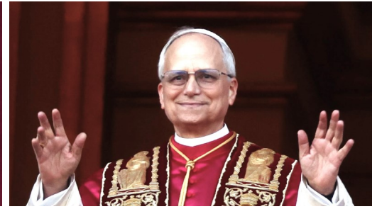
Los gestos, en el primer saludo y bendición