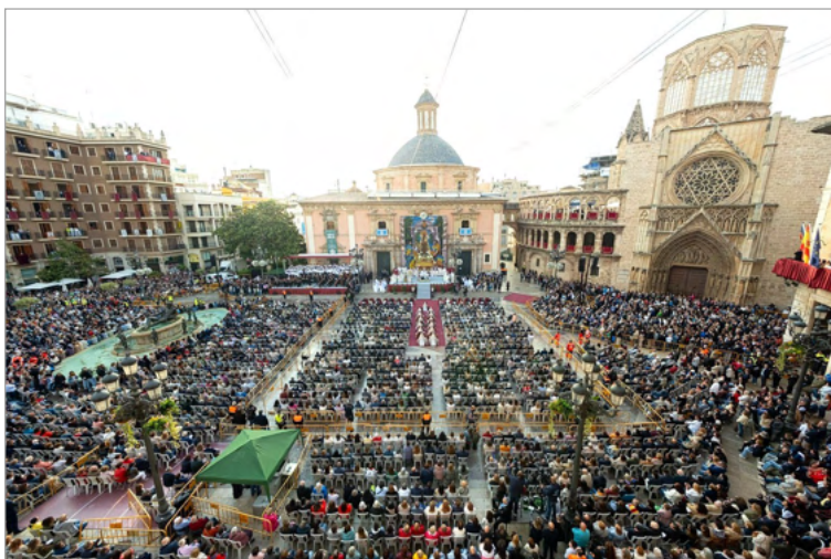
Missa d'Infants. Aspecto de la Catedral al final del Traslado. El Arzobispo agradece al Nuncio su presencia.

La siempre masiva y emotiva fiesta de la Mare de Déu tuvo este año un acento especial en el recuerdo de los que han sufrido por las inundaciones del pasado octubre, singularmente en la Misa d'Infants, en la que participaron los párrocos y alcaldes alcaidesas de las poblaciones afectadas, invitados por el Sr. Arzobispo.