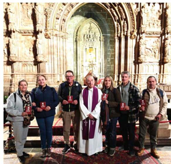
MASSAMAGRELL. Peregrinos de Catarroja partieron de Massamagrell a pie hasta el Santo Cáliz, el pasado 29 de noviembre.