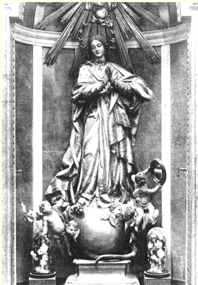
Imagen de José Esteve Bonet, muy dañada en 1932, y completamente destruida en 1936