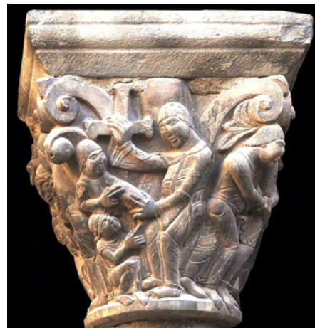
Capitel de Jaca

Sin ninguna tradición que lo avale, el descubrimiento de unos documentos en El Cairo, abren una nueva línea de investigación según la cual la Copa habría llegado a la Corona de Aragón procedente de El Cairo.