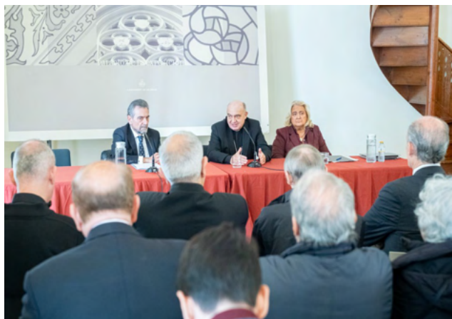
Mesa de la Inauguración del Congreso. F. V. Gutiérrez mcs/Arz.

En la sesión de apertura, el Arzobispo hizo hincapié en el hecho de que el Santo Cáliz «no es una leyenda que expresa un deseo que hay en el corazón del hombre de aferrarse a objetos sagrados, sino que hay un fundamento real, basado en datos históricos y arqueológicos. Estos congresos son necesarios para argumentar que la fe cristiana tiene una base, no está en contradicción ni con la cultura ni con la razón, ni con la historia. Estos lugares y objetos siempre permanecen en el misterio, que no se puede explicar racionalmente de una manera absoluta, por lo que este Congreso es también una manera de acercarse al