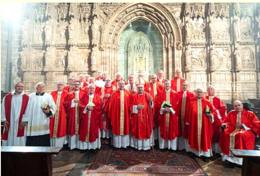
El Arzobispo con los canónigos de la Catedral.

Más tarde se encontró con representantes de la Real Hermandad del Santo Cáliz, y de la Cofradía del mismo. También tuvo su encuentro con las religiosas que atienden a la Catedral.