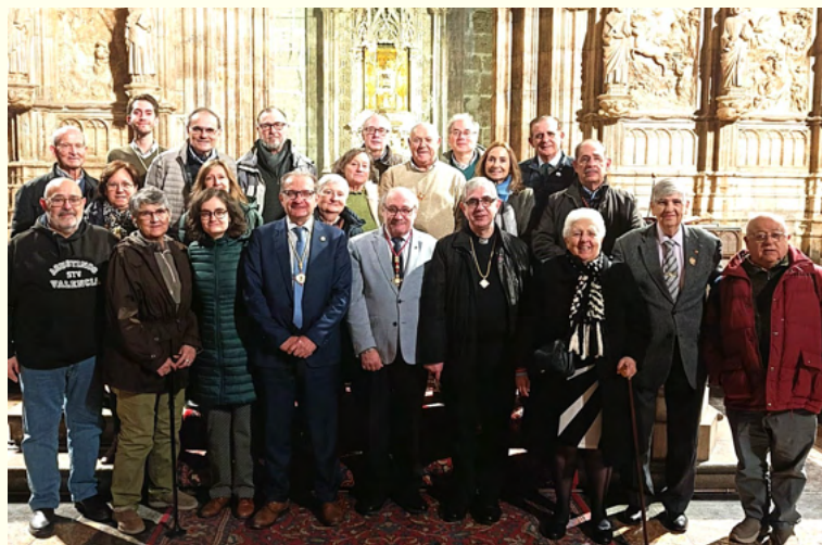
Cartel de las Jornadas, y algunos de los participantes