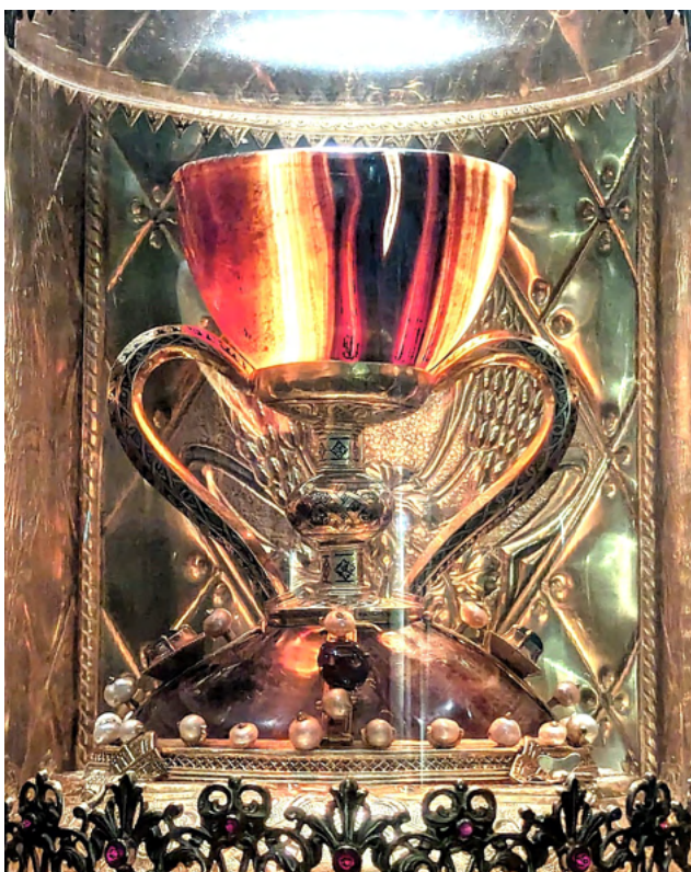
El Santo Cáliz original tal como se venera en su Capilla

Por una parte, siguiendo una práctica antigua una pieza en contacto con una reliquia, se convertía también en reliquia. Esta costumbre se pudo observar cuando se realizaron las últimas excavaciones en la tumba del apóstol San Pablo en la basílica de San Pablo extramuros de