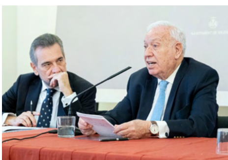
García Margallo, y el presidente de la Fundación Santo Cáliz, Carlos Alfonso

José Manuel García Margallo (que fue ministro de asuntos exteriores, y eurodiputado) desarrolló la ponencia sobre “El Santo Cáliz de Valencia en el Escenario Internacional”, en la que presentó la sagrada reliquia como “un símbolo para toda Europa, y para la civilización cristiana occidental, que está en la base de lo que debe ser la Unión Europea y el futuro Estados Unidos de Europa”, y manifestó que “el Santo Cáliz, el Grial, es una de las reliquias más importantes de la cristiandad, y uno de los símbolos más importantes de la civiliza-