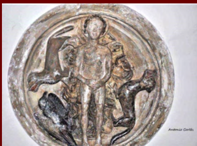
Claves en la capilla externa de la plaza de la Almoina

la imagen plateada obra de José Esteve Bonet (1798), el mismo que los relieves de las pechinas con momentos de la vida del Santo y las esculturas de la Fe y la Esperanza sobre el retablo.