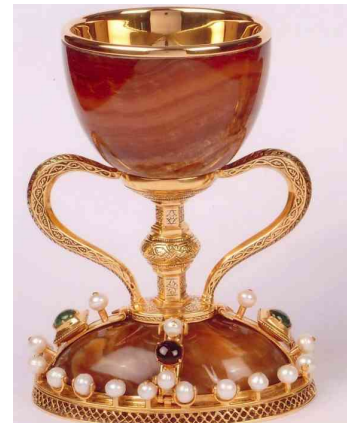
Uno de los modelos de Piró