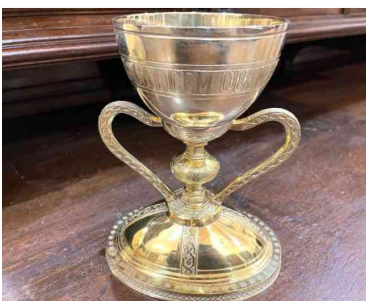
Réplica del S. D. José M o Caplliure (1920)

Por diversas circunstancias, existen otras copias en Argentina (un seminario en Buenos Aires), Brasil (una parroquia en Sao Paulo y un particular), Colombia (una parroquia en Bogotá y un particular), Venezuela (un sacerdote), Panamá (Parroquia de la Merced de Panamá), México (un sacerdote y un particular), Estados Unidos (un sacerdote en California, y particular en Nueva York), Canadá (una familia en Vancouver), Portugal (Santuario de Fátima), Francia (un sacerdote en París, una parroquia en el norte de París, un sacerdote en Vannes, y un particular en Grenoble), Italia (Roma, Milán, un particular en el norte de Italia), Tierra Santa (Cenáculo, y Domus Galileae), Alemania (una parroquia, un particular), Inglaterra (un particular), Polonia (una parroquia, un particular), Hong Kong (una parroquia), Taiwan (una parroquia).