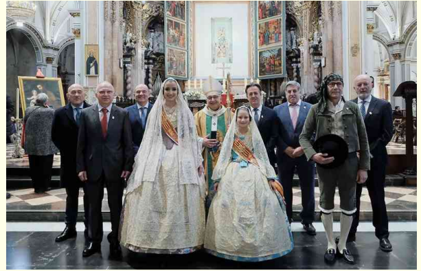
El Arzobispo, con las Falleras Mayores, el concejal de Fallas, y Junta del Gremio de Carpinteros.

También destacó que San José era feliz: el Fill de Déu vivía en sa casa; la seua humil casa de Natzaret era la casa de Déu, i per això Sant Josep era feliç, perquè tenia el tresor més gran que es pot tindre (...) Eixe tresor que, si no el tenim, que és conèixer el Senyor, encara que tinguem moltes coses, acabem interiorment buits. Sant Josep va ser feliç perquè vivia en la casa de Déu, perquè Déu vivia en sa casa i sa casa era la casa de Déu”.