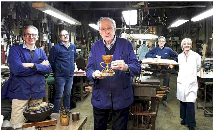
La familia de Orfebres Piró

Por otro lado, también poseen réplicas la Santa