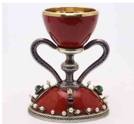
Réplica de los años 40 del siglo XX