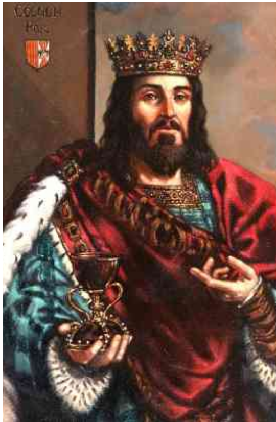
Obra reciente, de Pedro Arrúe, adquirida por el Ayuntamiento

Fue un monarca de una gran religiosidad y piedad, lo que le valió el sobrenombre de "el eclesiástico". Logró reunir una de las colecciones de reliquias más importantes de la Europa medieval, entre las que destacaban las relacionadas con la Pasión del Señor. Muchas de estas piezas pasarán después a la catedral de Valencia, entre las que destacan el Santo Cáliz y el Lignum Crucis. Cada 9 de noviembre celebraba, una solemne fiesta en la que se mostraban las reliquias que el monarca de la Corona de Aragón conservaba en su capilla real de Barcelona. Aunque trató de concentrar todas las reliquias en su capilla real